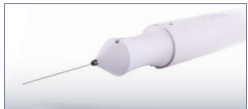
DORC TDC Подвійний зріз для ефективної вітректомії

Створена для чудової стабільності передньої камери, високої ефективності ультразвуку та скорочення ефективного часу факоемulsифікації.