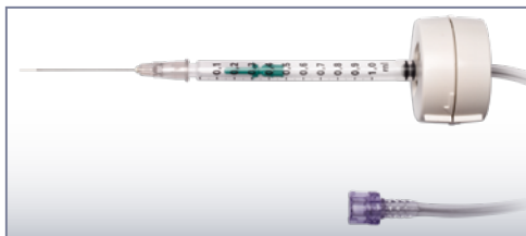
EVA INICIO™ Перша схвалена офтальмологічна система для мікроін'єкцій

Розроблений для покращеного різання та оптимальної продуктивності — ідеально доповнюється гідродинамікою Vacuflow VTi.