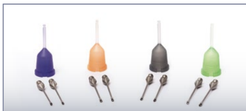
EVA EQUIPHACO™ Технологія факоемulsифікації нового покоління EVA

Створена для чудової стабільності передньої камери, високої ефективності ультразвуку та скорочення ефективного часу факоемulsифікації.